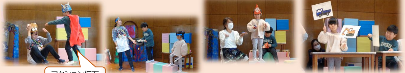
アクション仮面 参上！