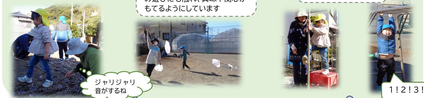
ジャリジャリ音がするね