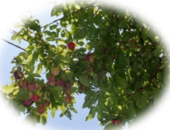
たくさんのプラムが できました66