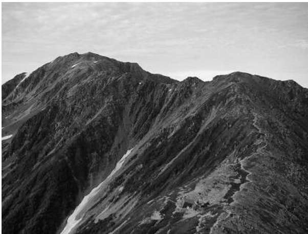
静岡市で一番高い山 間ノ岳（あいのだけ） 3,190m