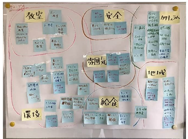
付箋を用いた意見の書き出し (例：A班)

テーマ：第3回「地域と学校とのつながりについて」 日時：8月17日(火)19:00～21:00 場所：蒲原中学校 視聴覚室