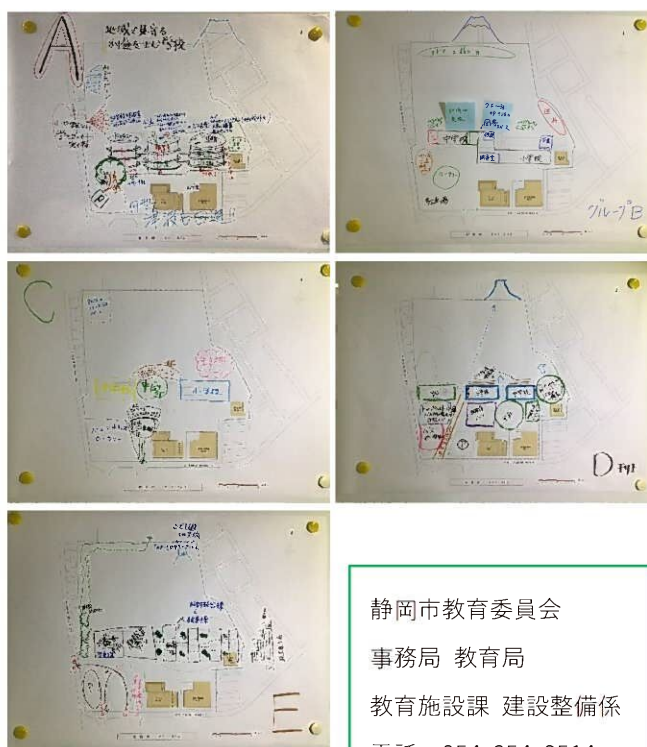
各班のゾーニングプラン

静岡県教育委員会 事務局 教育局 教育施設課 建設整備係 電話：054-354-2514