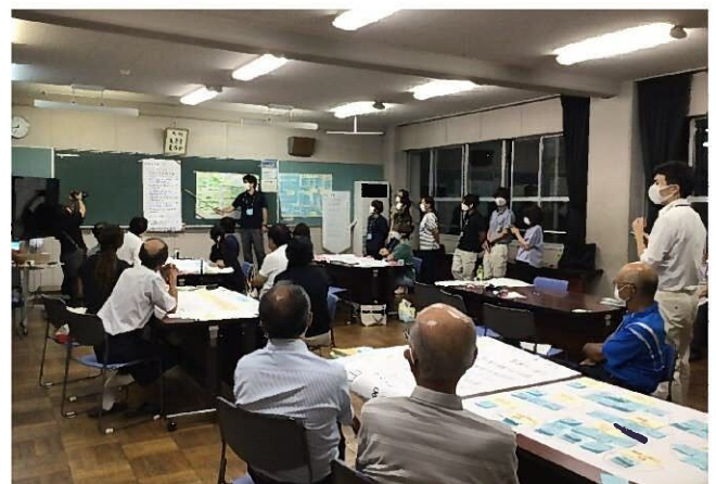
グループ発表の様子

静岡市教育委員会事務局 教育局 教育施設課 建設整備係 電話：054-354-2514