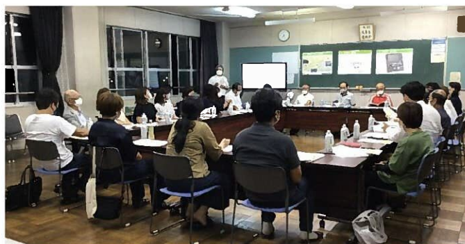
(ワークショップの様子)

静岡市教育委員会事務局 教育局 教育施設課 建設整備係 電話：054-354-2514