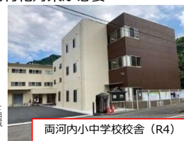
両河内小中学校校舎（R4）

※アセットマネジメント： 計画的に効率的に施設の整備や維持管理を行うことで施設の寿命を延ばしたり、利活用促進や統廃合を進めることで将来負担の軽減を図り、都市経営上の健全性を維持していく手法