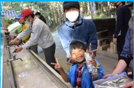
井川の大～きいさつまいもを焼き芋に！