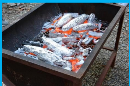
炭火で焼いも！いいにおい！上手に焼けてる？