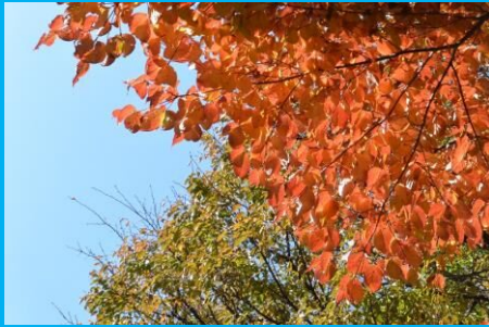
気温零度の冷え込み！紅葉シーズン突入！