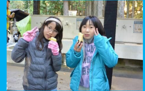
あま～い！ホクホク！焼きいも大好き！！