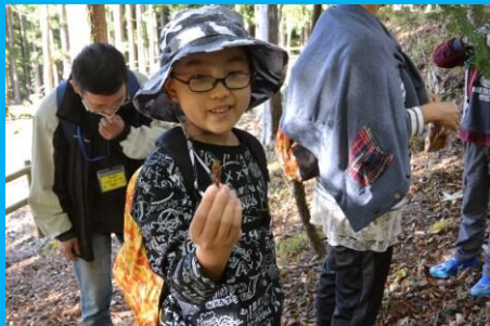
秋の所内を散策！マツボックリのエビフライ発見！