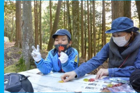
秋の色に染まった落ち葉でしおりづくり！