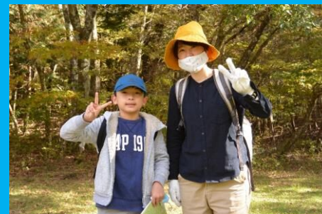
トラン4kmコースでウォークラリー！秋満喫！