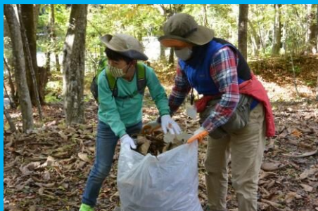
フカフカの落ち葉集め！落ち葉でベッドも作ったよ！