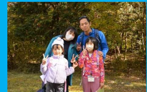
歩くとあったかいね！家族みんなでゴール！