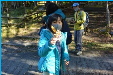
きれいなカエデの葉！後でしおりにしよう！