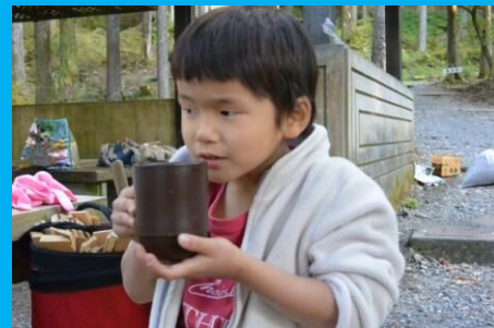
香りのよい井川紅茶も飲んだよ！「あったまる～！」