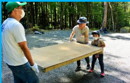
家族で力を合わせて、テントの土台を運ぼう！