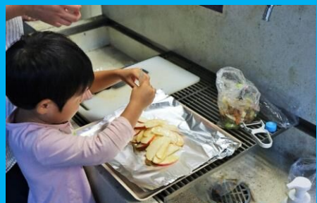
りんごにはちみつとバターをたっぷり！美味しそう！