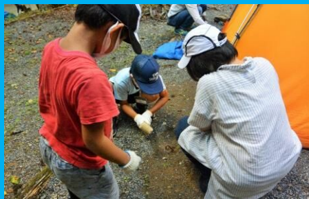
大人に見守られながら、子どもたちが大活躍！