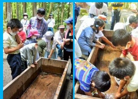
アマゴの串焼き体験 「いのち」をいただきます！