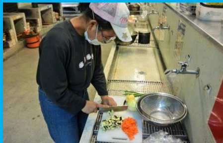
火が通りやすいように、うすく・小さく切ろう！