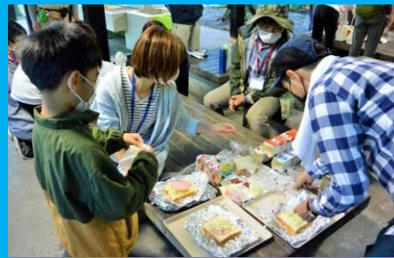
牛乳パックを燃料にしたホットサンド作り！