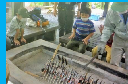
自分でさばいたアマゴ、美味しく焼けたかな？