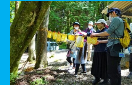
玉ねぎの皮を使った草木染め！きれいに染まったよ！