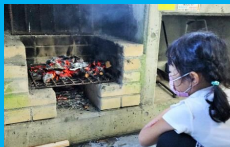
焼きりんご、上手にできるかな？