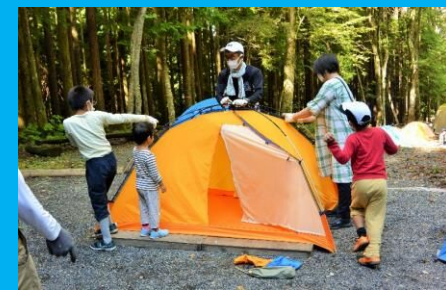
テントの片付けも、家族みんなでがんばるぞ！