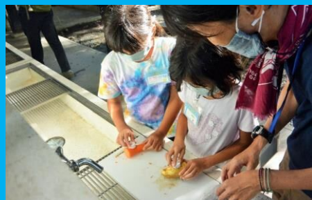
エコッキングに挑戦！生ごみを減らすよ！