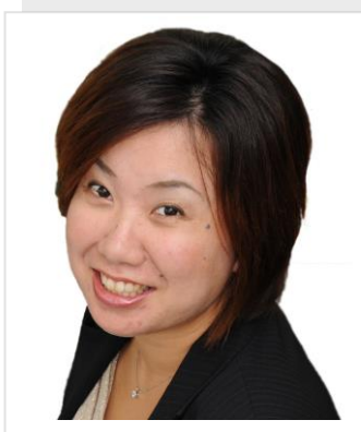
一般社団法人 グローバル人財サポート浜松