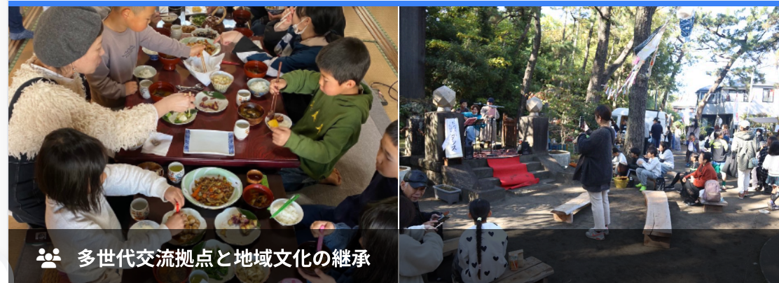
👥 多世代交流拠点と地域文化の継承