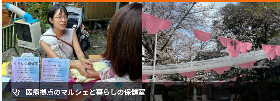
📍 医療拠点のマルシェと暮らしの保健室