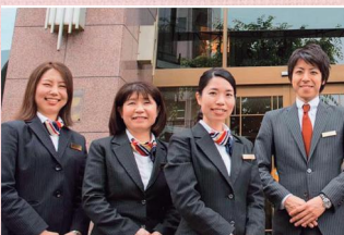
ホテルクエスト清水 スタッフのみなさん