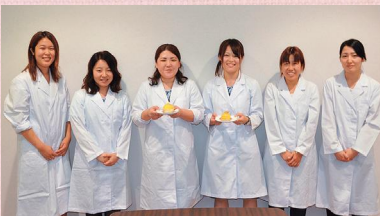
栄養科のみなさん

平成28年、新たに「ウェルビーSweets」を開発しました。彩りよく、見た目も常食に近づけ、高齢者の食欲を高めるスイーツ(桜餅、モンブラン、あんみつ)です。