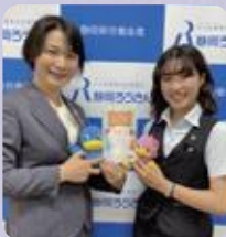
スタッフのみなさん

企画から販売まで関わっている女性職員の「不妊治療をサポートしたい」という強い思いを感じる。妊活のサポートが必要な人にぜひ届いてほしい。