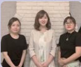
スタッフのみなさん

作曲から映像まで完全オリジナルであり、月日を経るごとに価値が増していく商品である。