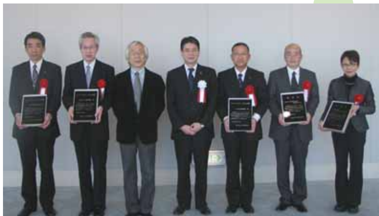
各企業・事業所代表者と福本俊明副市長（当時）、佐藤博樹東京大学社会科学研究所教授