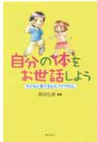
『自分の体をお世話しよう 子どもと育てるセルフケアの心』 奥田弘美編著 ぎょうせい

本書では、自分の心身を自分で守る概念である「セルフケア」を子どもと大人と一緒に学ぶことができます。子ども向けにはイラストや不思議な童話を交え、大人向けには詳しい解説を載せており、それぞれが心身をいとおしむことを見直すきっかけとなる一冊です。