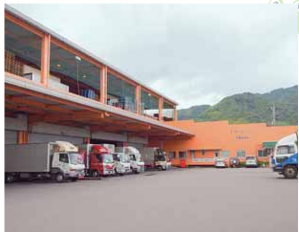
平和みらい株式会社焼津物流センター

当社はこれからも、ワーク・ライフ・バランス推進に取り組んでいきます。会社としては、両立支援の重要性を理解しながら、社員のためにいろいろな選択肢を設けるとともに選択の尊重を進めていきたいと考えています。仕事と家庭の両立を希望する者、今は仕事に軸を置きたい者などすべての社員の選択を尊重できるよう制度を整えていくことにより、社員には仕事に前向きに取組み、生産性を上げるよう努力して会社に還元してほしいと考えています。