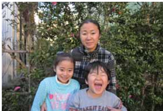
筆者とお子さん（10歳、6歳）

それが、今や3人の子持ち！子育てに追われる日々になるうとは、学生時代には、まさか想像もしなかったことだ。朝は子どもたちの「お腹すいた〜！」の声ではじまり、幼稚園や習い事の送迎に家事、「いいかげんにしなさい！」と子どもを叱り、1日が終わる。多かれ少なかれ、夫の手助けがないとやっていけない。夫は職場で戦うというが、妻は毎日家庭で戦っている。