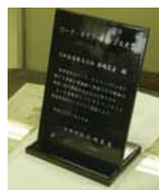
大賞受賞3社には駿河漆器の楯が授与されました。

3事業所とも、ワーク・ライフ・バランスに関する先進的な制度の構築及び職場全体での積極的な取組に対し、他の模範となることが評価されました。