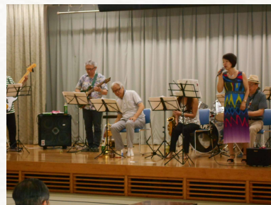
ステージで 演奏を披露

音楽は心を豊かにしてくれるもの。ウクレレ、オカリナ、大正琴など、やってみたい楽器に挑戦してみたい方はぜひ。鍵盤ハーモニカやリコーダーなど、懐かしの楽器を楽しめる教室もあります。歌を歌って心身ともにリフレッシュするのもおすすめ。合唱、カラオケ、唄声喫茶、ボイストレーニングなど、みんなで素敵な歌声を響かせてみませんか。