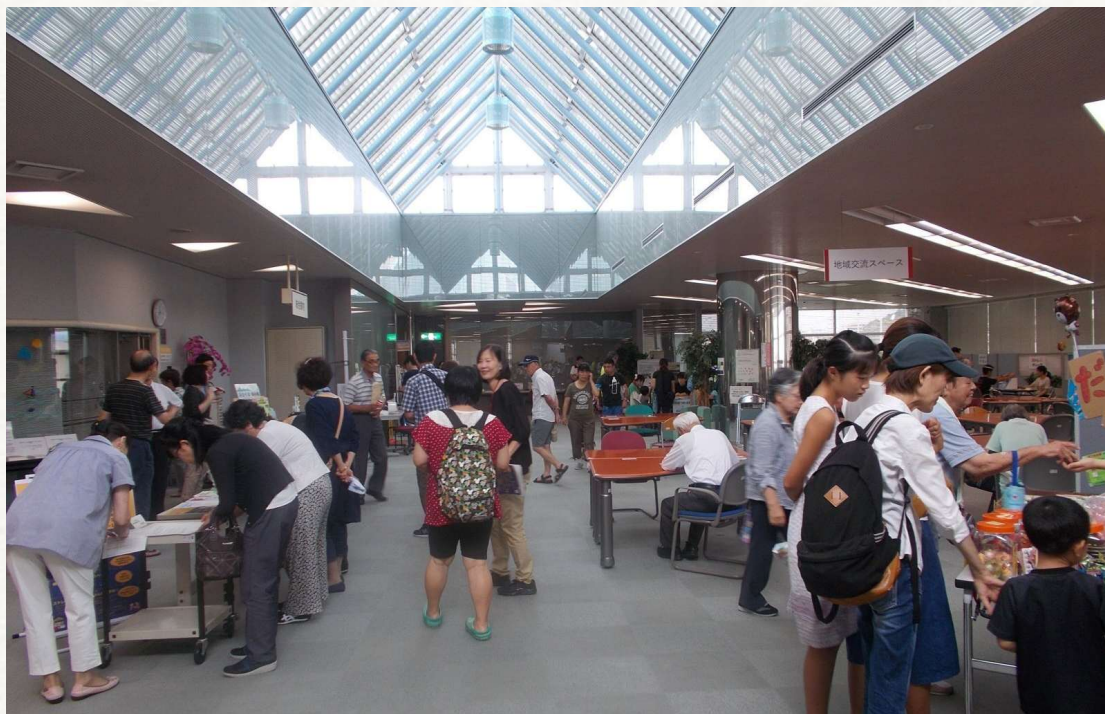
地域交流スペースで開催した多世代交流イベント「みなくるミニフェス交流会」