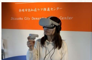
VR体験で認知症の人の気持ちを理解

専門的で丁寧な相談対応 スタッフはみな、医療・介護・福祉の専門職です。「家族が認知症かもしれない」「認知症の人とのかかり方が知りたい」など、認知症に関して心配なこと、気になることがある方はお気軽にご相談ください。