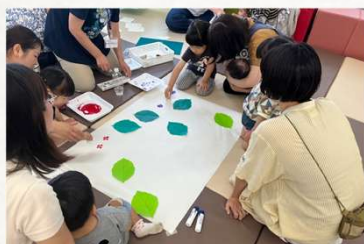
「みなくる親子カフェ」

駿河区の南部図書館2階にある「みなくる」は、地域に住む人たちが世代を超えて交流できる場所です。みなくるでは、健康フェスタ、多世代交流会、映画上映会など、バラエティに豊かで、子どもからシニアまで参加できる催しがたくさん開催されています。また、認知症予防講座や、発声による健康講座など、健康長寿に役立つ講座も充実しています。