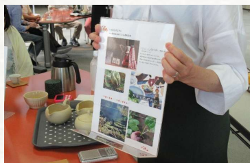
「おいしいお茶を楽しもう！」