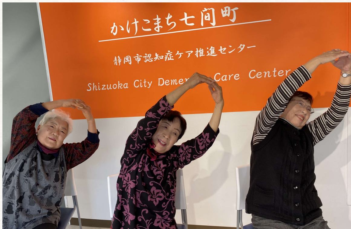
楽しいイベントを多数開催