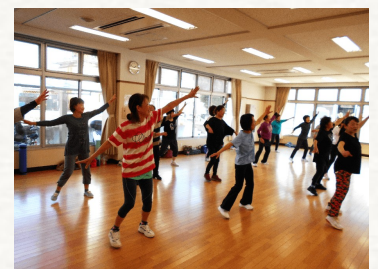
レクリエーション ダンス