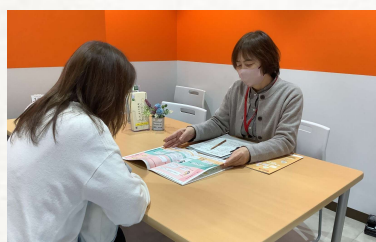
経験豊富な相談員が相談に応じます