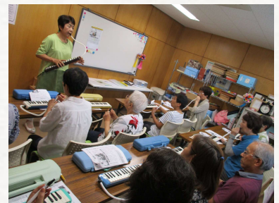
鍵盤ハーモニカ 教室