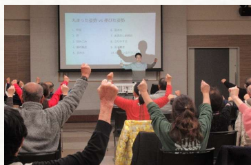
健康講座「声から元気に」

さらに、講座だけでなく、実際に血圧、体組織握力を測定できる器具を置いており、誰でも自由に利用することができます。そのほか、事前予約により有料で利用できる地域交流ホールや会議室のほか、市民活動のミーティングや交流イベント等を無料で自由に利用できる地域交流スペースもあります。こちらもぜひご利用ください。