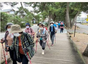
ノルディックウォーキング

しぞ〜かでん伝体操などのご当地体操、体幹トレーニング、ノルディックウォーキング、音楽療法、脳トレ、健康マージャンなど、みんなで楽しみながら、介護予防ができます。