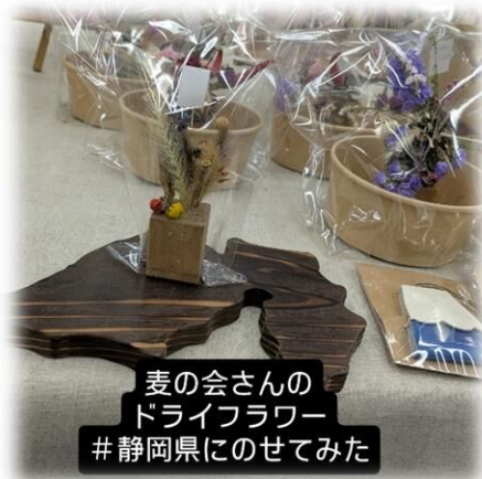
麦の会さんの ドライフラワー #静岡県にのせてみた