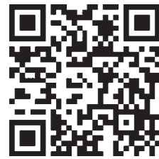
QRコード (申込フォーム)