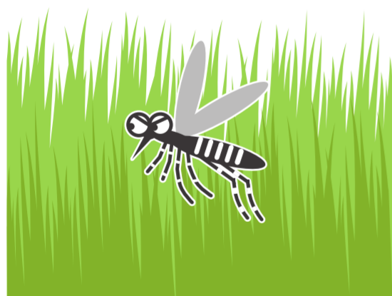
風通しの悪いやぶ・草むら

公園、学校、寺社、空海港、駅などの施設を管理されている方もご協力をお願いします!