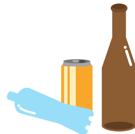
屋外に放置された空きビン・缶・ペットボトル