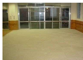
藁科保健福祉センター