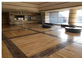
清水保健福祉センター