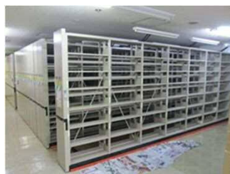
南部電動書架修繕の様子 (水害を免れた資料の移送完了)