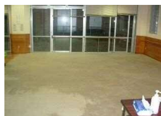
藁科保健福祉センター