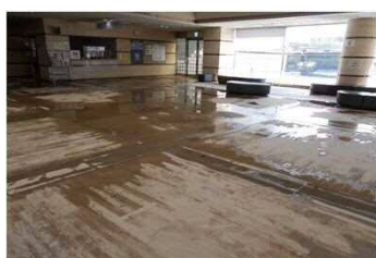
清水保健福祉センター