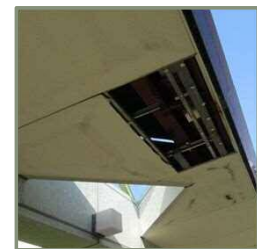
南部図書館被害状況