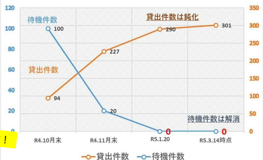
無償自動車貸出事業申込状況 (R5.3.14時点)