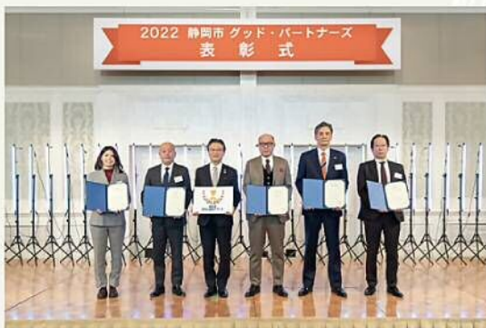
令和4年度 表彰式の様子

事業所・団体間の連携促進のため、ご応募いただいたすべての取組を事例集として公表・配布します