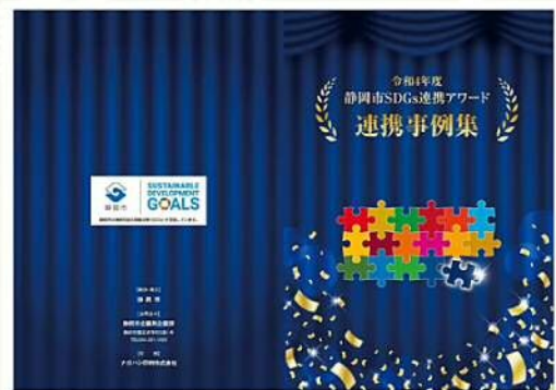
令和4年度 SDGs連携アワード事例集