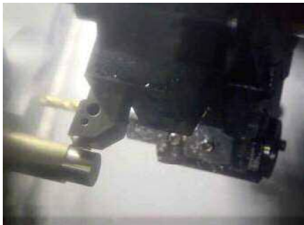
▲旋盤加工に特化した「丸もの」専門の部品メーカーです。