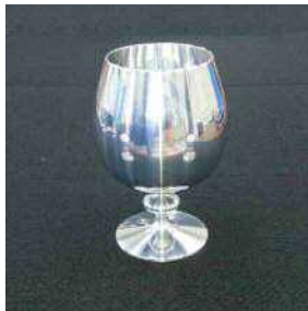
▲旋盤加工技術の高さを象徴する金属製のワイングラス。同社が掲げる「美しい製品づくり」が影射されています。