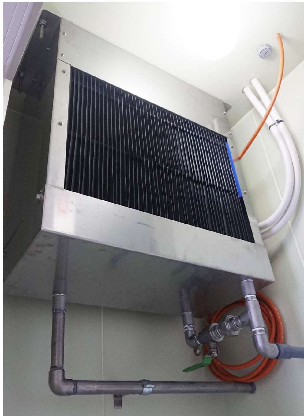
▲青果物をエチレンとAIで熟度コントロール、希望出荷時期に出荷が可能になります。現在オープンイノベーションにて開発を行っております。