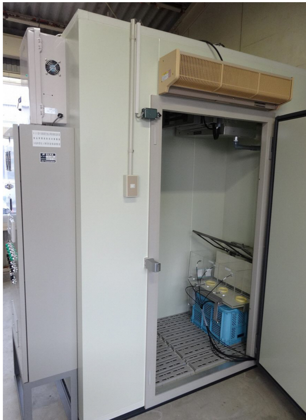
▲結露をさせず加湿可能なエアウォッシャーとオゾンの組み合わせにより、庫内の野菜・青果物等を長期保存。廃棄ロスの削減、出荷調整が可能になり農業の働き方改革に寄与します。