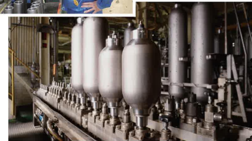
▲一貫生産の高品質アキュムレータ

しかし今後、入手・廃棄が容易であり、かつクリーンで安全な弊社の水圧駆動が加わることで、技術革新をはじめ、持続可能な産業発展や新たな社会価値創出の促進に貢献することが出来るようになります。