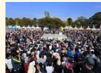
大道芸ワールドカップ (大道芸ワールドカップ実行委員会)

主な事業：「まちは劇場」推進事業、清水七夕まつり開催事業 大道芸ワールドカップin静岡開催事業