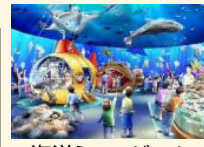
海洋ミュージアム