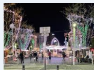
イルミネーション

主な事業：商店街環境整備事業、おまちストリートWi-Fi整備事業 青葉シンボルロードイルミネーション装飾事業