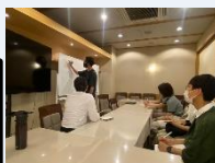
大学生によるお店コンサルティング事業

主な事業：事業承継支援事業、商業活性化グループ事業 大学生によるお店コンサルティング事業