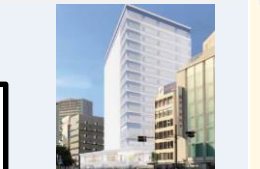
御幸町9番・伝馬町4番地区第一種市街地再開発事業

主な事業：御幸町9番・伝馬町4番地区第一種市街地再開発事業、 松坂屋静岡店リニューアル事業