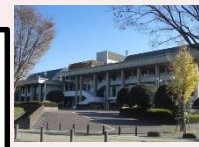
静岡市民文化会館