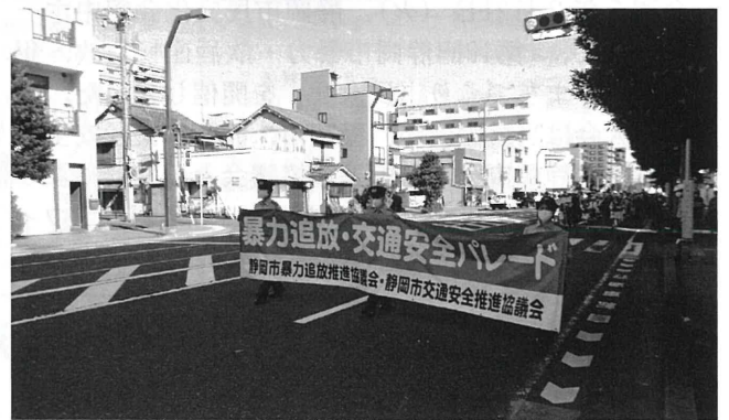
新通小学校シンフォニッククラブの子どもたちの演奏を先導として啓発パレードが行われた