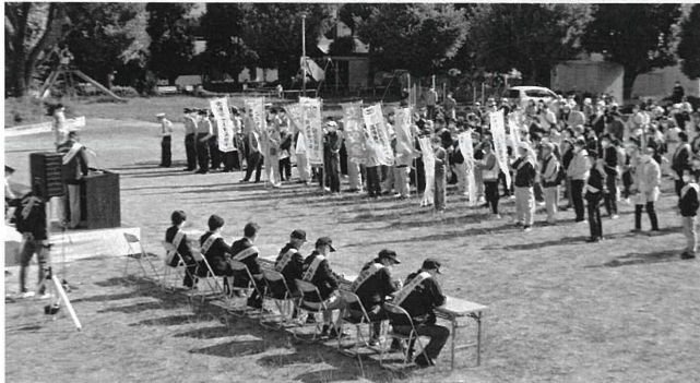
約300名の地域住民が参加

大会には、来賓として静岡中央警察署長・静岡県暴力追放運動推進センター相談員等協力機関代表者の方々を迎え、地元住民約300名の皆様の参加のもと、暴力や事故のない安心で安全に暮らせるまちづくりを目指す決意を新たにしました。