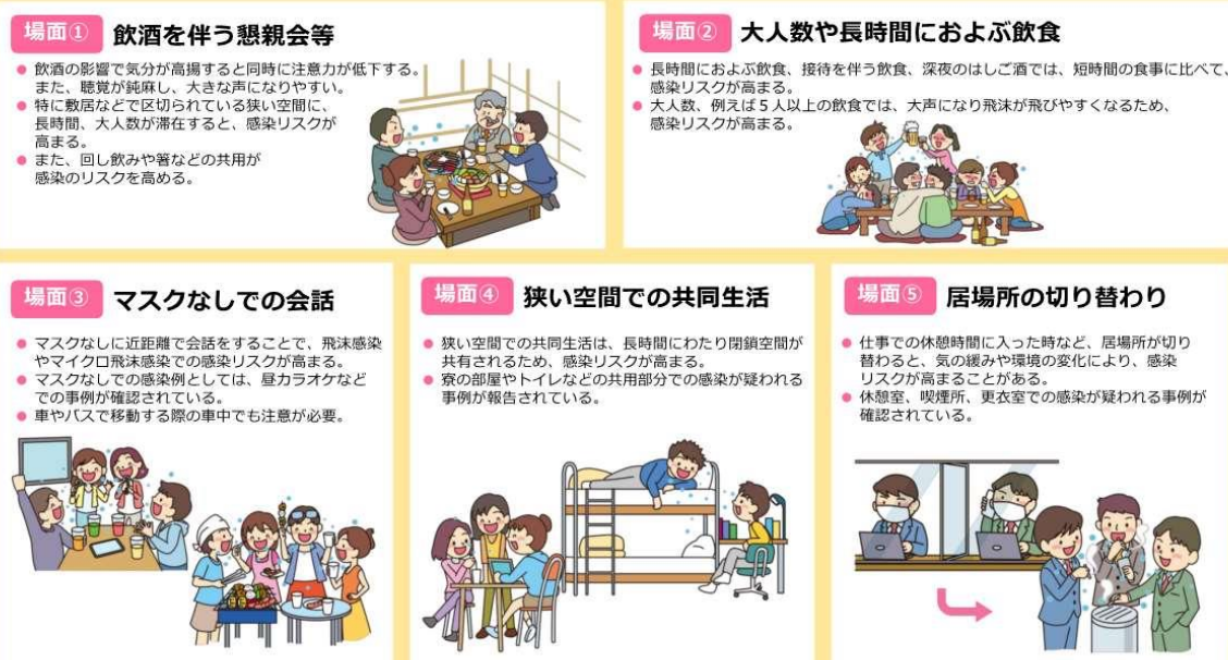
図2 感染リスクが高まる「5つの場面」