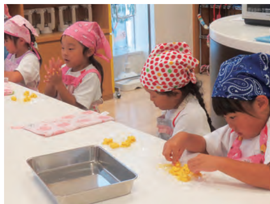
スノーボールクッキーを作りました