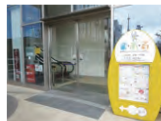
1F エスカレーター入口

ま・あ・る専用の駐車場はございません。駅西側（ま・あ・る側のエリア）は、公的な駐停車可能場所がほとんどなく、厳しく行政指導がされているため、駅東側（ま・あ・ると反対側のエリア）で乗降していただくことをおすすめしています。乗降場所については、バス会社とご相談ください。