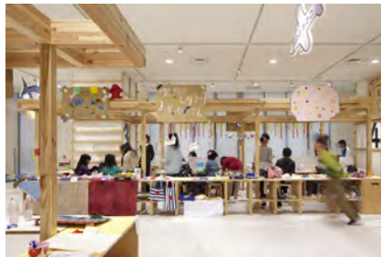
3F こどもバザールエリア