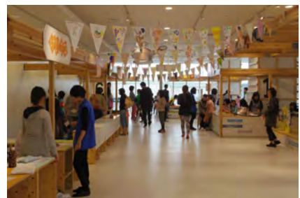
3F こどもバザールエリア