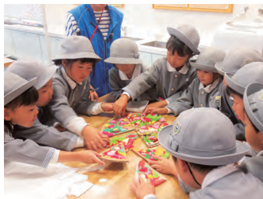
布切れを貼り付けてピザを作りました