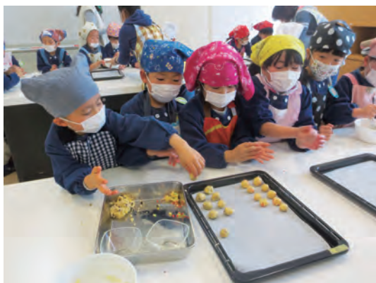
かぼちゃのおだんごを作りました

発達段階に応じたかんたんなクッキングを提案致します。季節の食材や、幼稚園・保育園で行っているクッキング経験をふまえて内容を選ぶことができます。