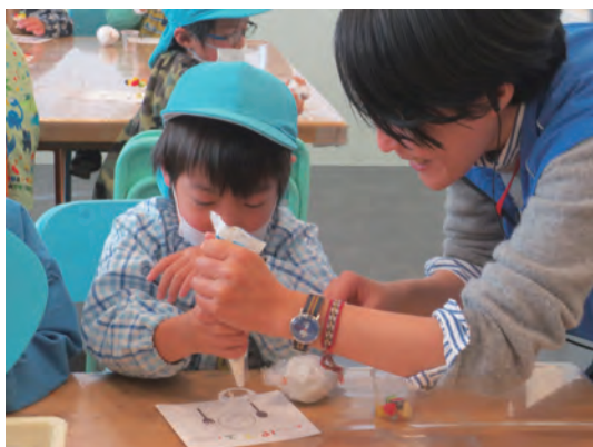
ホイップ粘土でパフェを作りました

布や粘土、ダンボールなど様々な素材を使って40分程度の工作体験をします。作ったものを使ってごっこ遊びもできます。