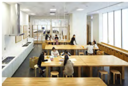
4F わくわくアトリエ