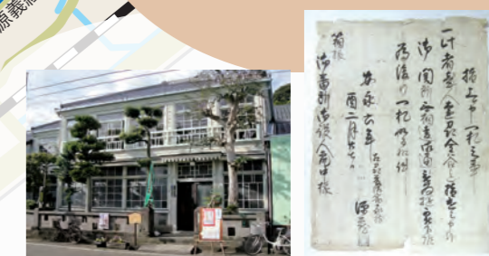
旧五十嵐歯科医院 約240年前の関所手形 志田邸

1601年、徳川家康公は江戸から京都までの宿駅制度を設けた時は、東海道の宿場は40カ所程でした。その後、1615年、豊臣家を滅亡させ、大阪までのルートを延伸させ、1624年、家光公の時代に江戸から京都までが53の宿場と大阪まで「伏見宿」「淀宿」「牧方宿」「守口宿」を入れて57の宿場で東海道としていたようです。