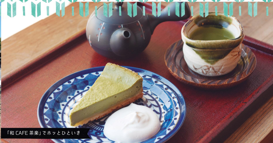
「和 CAFE 茶楽」でホットとひといき