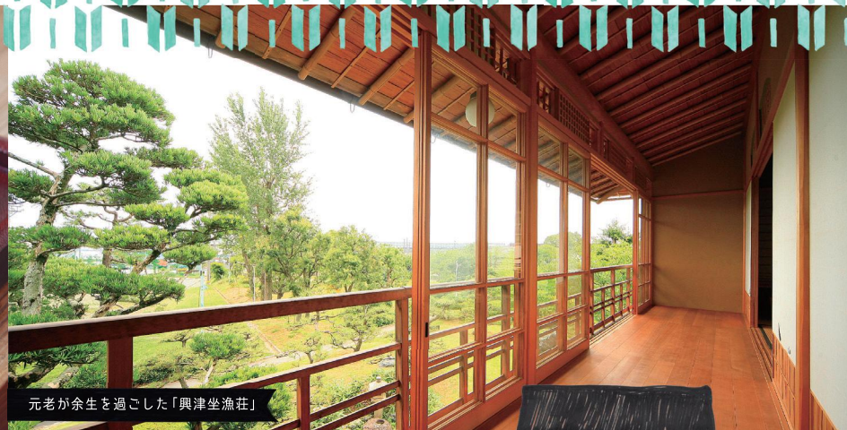
元老が余生を過ごした「興津坐漁荘」