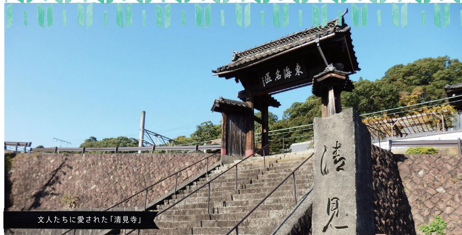
文人たちに愛された「清見寺」