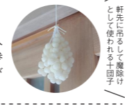
軒先に吊るして魔除けとして使われる十割そば

SPOT 01 慶龍寺 けいりゅうじ 宇津ノ谷峠を越える旅人が、鬼に会わぬようにお参りしたという延命地藏尊が安置されているお寺。 ☎054-259-1309 📍静岡市駿河区宇津ノ谷729-1 🕒無料