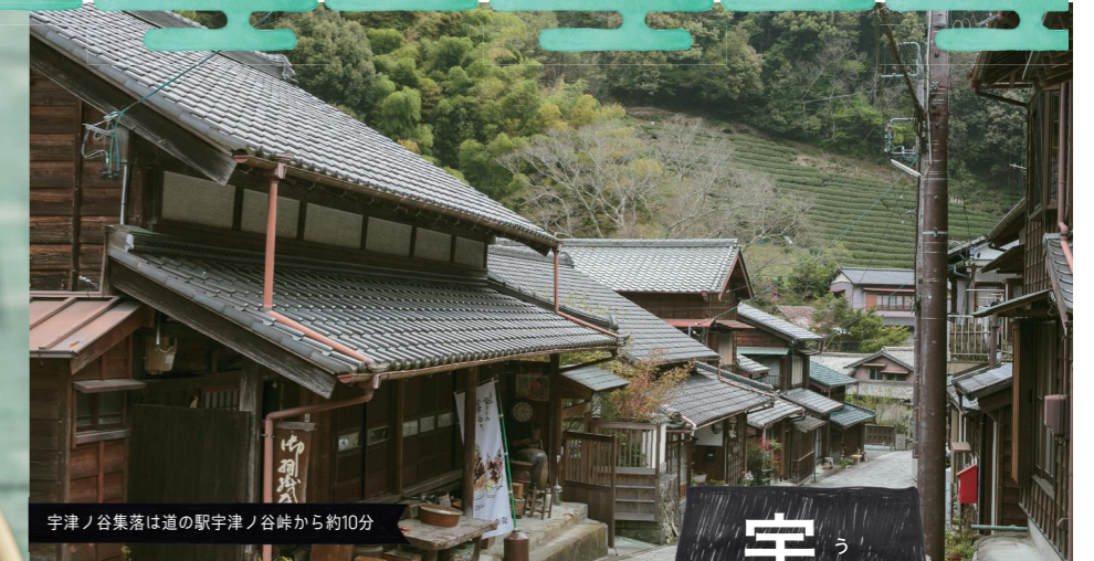
宇津ノ谷集落は道の駅宇津ノ谷峠から約10分