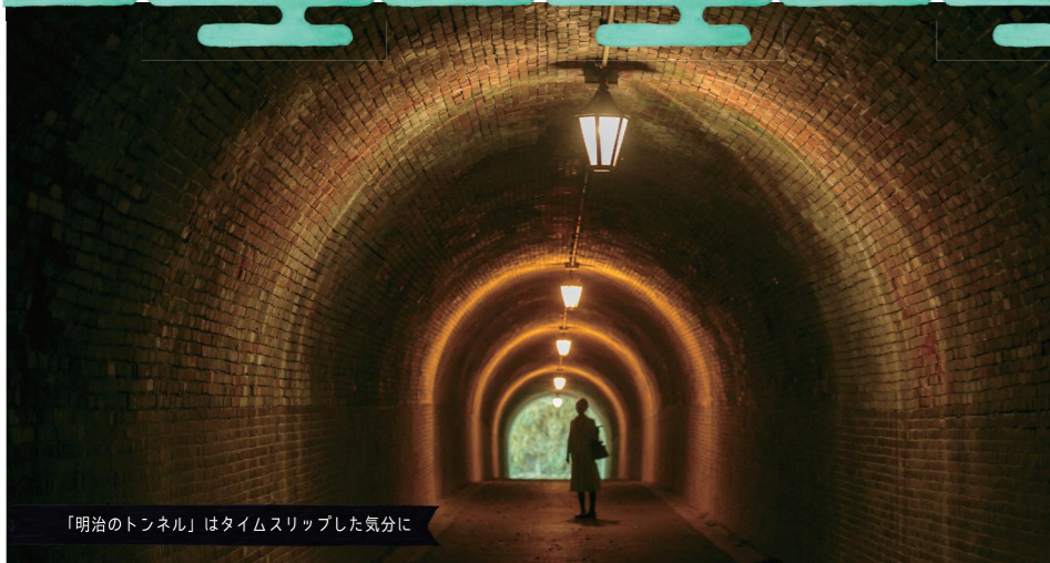
「明治のトンネル」はタイムスリップした気分に