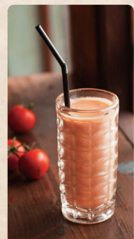
もぎたてトマトのフレッシュジュース

おみやげはココ！ GOURMET おかしとおくりものぶいー 04 川村農園カフェ 焼菓子とアイシングクッキーの専門店。丁寧に作られたクッキーは感動モノ！ 054-334-5705 静岡市清水区三保1-710-2 10:00~19:00 水曜、木曜