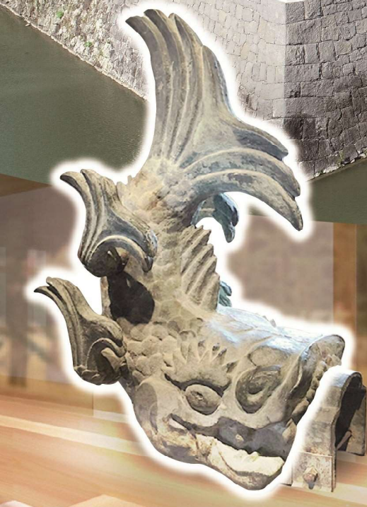
二ノ丸堀から発見された青銅製鯨 (静岡市指定文化財)