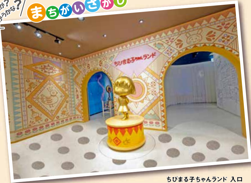
ちびまる子ちゃんランド 入口