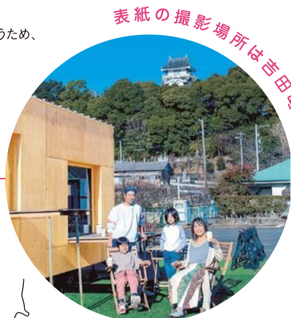
表紙の撮影場所は吉田町！

とおとうみのくに 戦国時代、武田信玄が遠江国を押さえる第一歩として 拠点にしていた小山城。 城の周りは散策コースになっていて 三日月堀や三重堀など歴史好きは必見です。 散策を楽しんだら駐車場にある トレーラーハウス&カフェで一休みしませんか。 小山城前 アンテナショップ&カフェ (吉田町片岡2499-2)