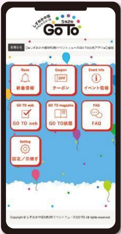
▲画面はイメージです。

しずおか中部5市2町イベントニュースGO TO公式アプリです。静岡市・島田市・焼津市・藤枝市・牧之原市・吉田町・川根本町のイベント情報等をお届けします。