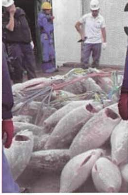
▲冷凍マグロの水揚げ風景