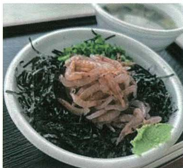
▲「生桜えび丼」は鮮度抜群！ ぷりぷり食感を楽しめます