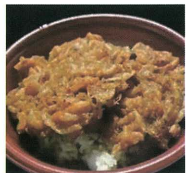
▲1番人気の定番「かき揚げ丼」 サクサクでボリューム満点