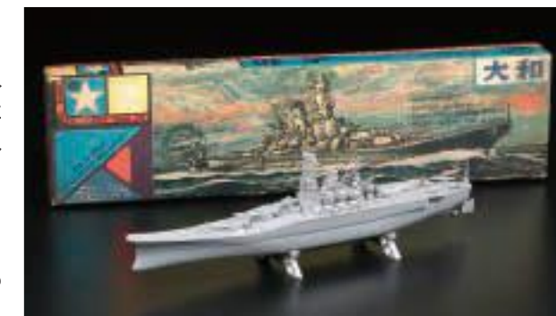
タミヤ初のプラモデル 1/800 大和 (昭和35年)

そんな激動の時代を、情熱、知識、努力の全てをかけて乗り切り、現在のプラスチックモデルメーカーが誕生しました。だからこそ、世界中から愛される商品を市場に供給し続けることができるのです。