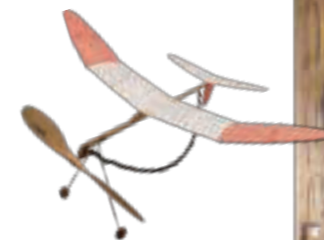
初期の木製模型飛行機