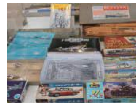
初期のプラモデル