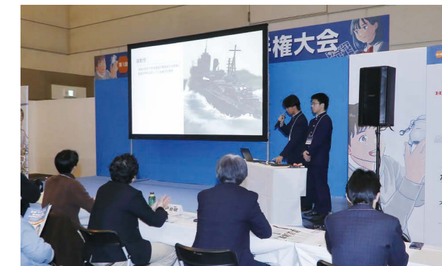
大会におけるプレゼンテーション審査の様子