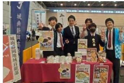
2023年11月産業フェア「ユメおはぎ」実施

城南静岡高等学校・中学校地域貢献部の生徒は、昨年11月26日にツインメッセで行われた“産業フェアしずおか2023”で「ユメおはぎ」を先行販売致しました。お客様に“赤米”の魅力を説明しながら販売4時間あまりで250パックを完売し「自分たちが作り上げた商品が、こうして世の中に出て夢のようだ！」と感動していました。