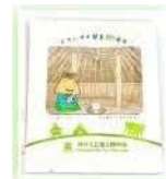
登呂遺跡スペシャルお茶パック販売

(11:00以降「ユメおはぎ」をご購入の方に、登呂遺跡スペシャルお茶パックをプレゼントします。ぜひ、遊び来てください！)