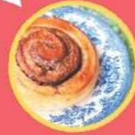
シリケカフェバーケリ (kirkekafebakeri) 北欧ノルウェーの 全粒粉たっぷりパン