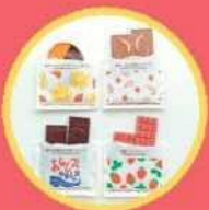
チョコレート Conche チョコレート チョコレート菓子等