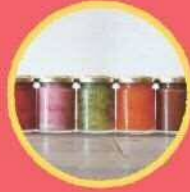
Chipakoya 季節のジャム、果実のコンポート、 焼き菓子等