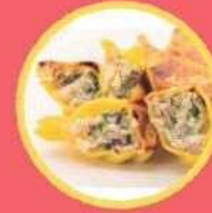
広東料理 棗 しずまえ用宗黄金餃子