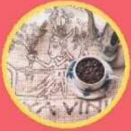
自家焙煎珈琲 いつもはフィッシャーマン ハンドドリップコーヒー、珈琲豆、 ドリップバッグ