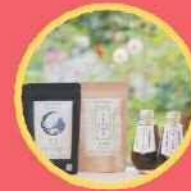
日本平紅茶 自然栽培の茶葉で作った紅茶、 旬のジャム