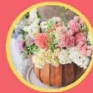
Flower & Leaf log ドライフラワー作品販売と ワークショップ