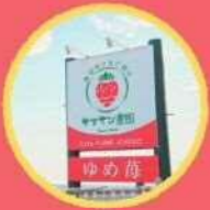
ヤマサン農園 ゆめ苺 バック入りいちご、いちご飴、 ぜんざい(いちご入り)