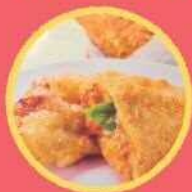
MARUSAN CAFE カルツォーネフリット ミートポテト、玉こんにゃく、芋煮 等