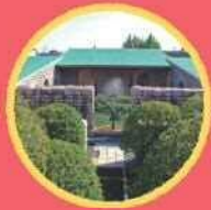
静岡市立 芹沢銈介美術館 (せりびワークショップ) 小絵馬を作ろう! ※ワークショップの開始時間までお待ち いただく場合がございます。