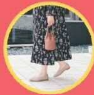
前田工業 Recipe & PennyLane 革小物・バッグ・靴 ワークショップ(ねこキーホルダー)