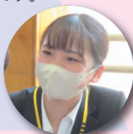
入塾時 大学3年生 静岡市内より通塾

多くの仲間とコミュニケーションをするようになったことで、つながりが増えていくのを実感しました。そのつながりと「入念な準備」によって、初めは時間がかかった判断も、自信をもってできるようになりました。コミュニケーションは「慣れ合い」ではなく、礼儀や係としての立場をわきまえた上で進めることで着実に信頼関係の深まりにつながりました。相手を尊重した関わりを大切に、児童や保護者、同僚からも信頼される教師を目指したいです。