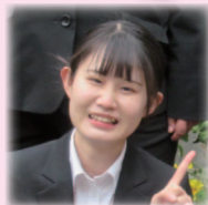
入塾時 大学3年生 静岡市内より通塾

自分から考えて行動することの意義や重要性、課題を見つけ解決することの楽しさを実感しました。意識が変化すると、自分の学びへの行動も変わり、探究的な学びによってその深さに気づき、自分から学びたいと思うようになりました。そのために意識が変わる瞬間を大切に、深く学ぶことの楽しさを子供に伝えられるようにしたいと考えています。「静岡市」「小学校教員」という二つの要素と常に隣り合わせて歩んできたことで、目指すべき姿を追い求め、覚悟をもって学ぶことができました。