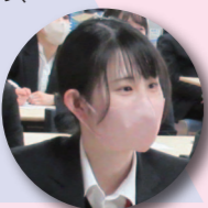
入塾時 大学3年生 静岡市内より通塾

自分から考えて行動することの意義や重要性、課題を見つけ解決することの楽しさを実感しました。意識が変化すると、自分の学びへの行動も変わり、探究的な学びによってその深さに気づき、自分から学びたいと思うようになりました。そのために意識が変わる瞬間を大切に、深く学ぶことの楽しさを子供に伝えられるようにしたいと考えています。「静岡市」「小学校教員」という二つの要素と常に隣り合わせて歩んできたことで、目指すべき姿を追い求め、覚悟をもって学ぶことができました。