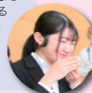
入塾時 大学3年生 東京都より通塾

しずおか教師塾での実践的な学びは、教師になった自分を助ける力になるという実感を持ちながら学ぶことができました。年齢や大学などが異なった仲間から、多くの刺激をもらって、自分の課題や目標を見出すことができたことや自分を見つめ直す機会が増えたことも成果です。また、教員採用試験の勉強を本格的に進めて行く過程や、自分が目指す教師像を改めて考えてみたことにより、得た知識を「私はこう使いたい」というように、学びに自分の意思が伴う感覚を毎回感じるようになった点が成長だと感じます。