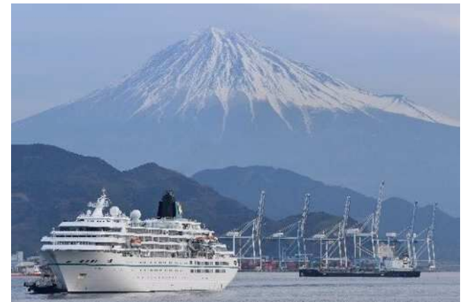
コロナ禍後、外国クルーズ船受入再開第1号の客船「アマデア」が清水港に寄港(2023年3月1日)