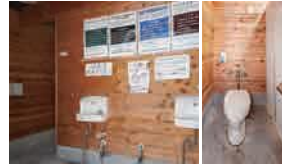
じこしよりがた といれ 自己処理型トイレ