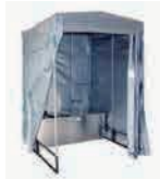
かせつといれ 仮設トイレ くみた がた (組立て型)