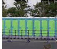
かせつといれ 仮設トイレ ぼくす がた (ボックス型)