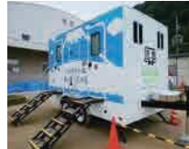
といれとれーらー トイレトレーラー