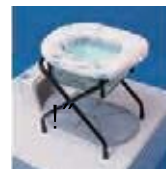
かんいといれ 簡易トイレ でんき つか (電気を 使いません)