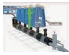
まんほーるといれ マンホールトイレ