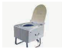
かんいといれ 簡易トイレ でんき つか (電気を 使います)