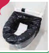
けいたい といれ 携帯トイレ