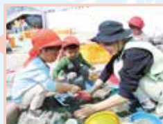
高齢化・少子化対策事業