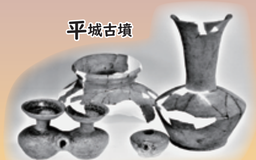
平城7号墳副葬土器