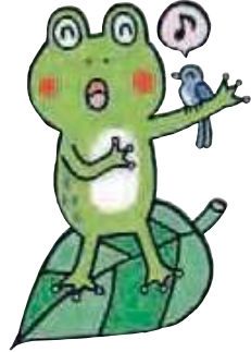
モリアオガエルのアオ太