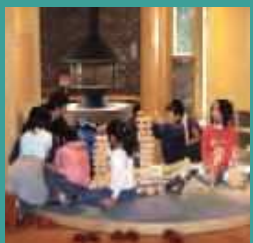
木と親しくなるコーナー