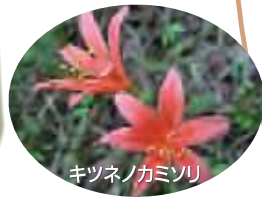
キツネノガミソリ