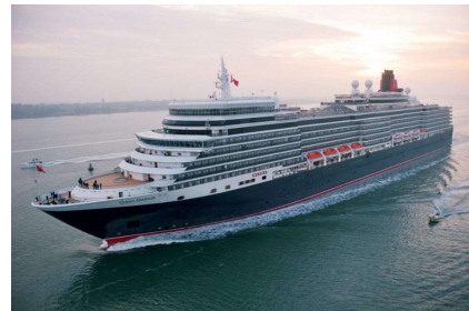
客船誘致委員会 公式 Instagram