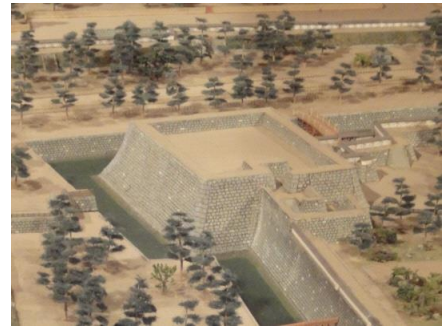
↑ 骏府城模型中的天守台部分 (现在东御门展示)

自2016年至2019年3月的三年期间将进行天守台整体的发掘调查工作，在第四年时，更深的挖掘天守台的内部，并调查在13~16世纪时支配现在的爱知县东部~静冈县西部、中部的今川氏时代的遗迹。