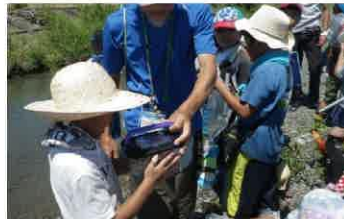
●川の生きもの観察