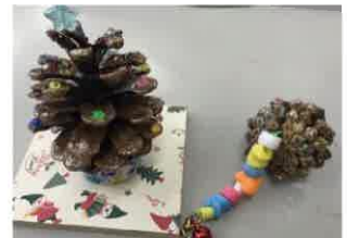
●自然物を使った工作