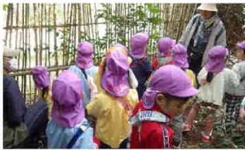
●身近な自然の観察