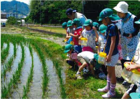
園周辺を散策しながら野草遊び（保育園）