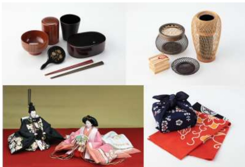
図 静岡市の伝統工芸品類例

そこで、域外に居住する者の知識及び技能を活用して本市の地域産業の活性化と後継者の育成を図るとともに、その定住を促し、地域産業の持続可能な発展に資するため、「地域産業地域おこし協力隊員」を募集します。